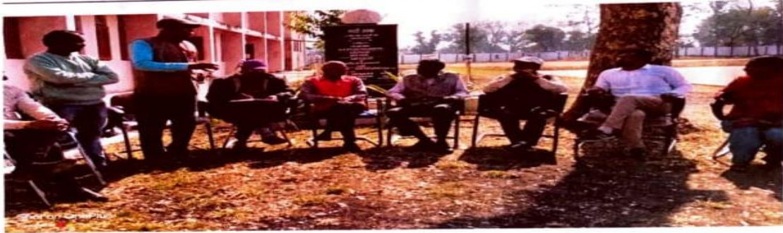
बाल संरक्षण सप्ताह पर आयोजित कार्यक्रमों की झलकियाँ